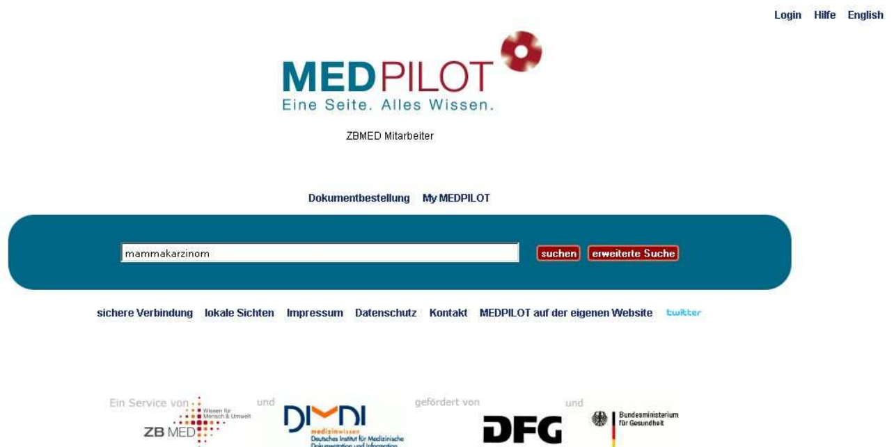
Abb. 1: MEDPILOT Startseite

Rufen Sie MEDPILOT über die Adresse http://www.medpilot.de auf.